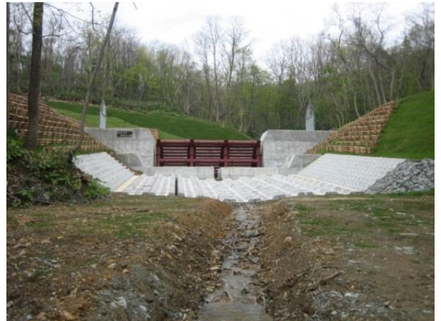
■ 樋門・樋管及び頭首工計画・設計

直下に保全対象の多い市街地が広がり、土石流発生時には甚大な被害が懸念される地域において、流水を下流に流し、土石流発生時には確実に土砂を捕捉する「横ビームえん堤」を採用し、設計を行った。