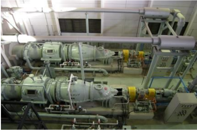
設置後 14 年を経過した排水機場

弊社では、札幌市近郊にある設置後 14 年を経過した排水機場の長寿命化計画策定を実施しております。