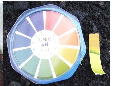
酸性硫酸塩土壤により酸性水が発生した例。湧出する地下水はpH3！